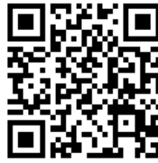
AU / Softbank